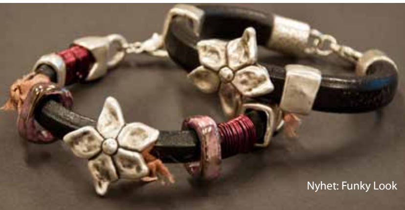
Nyhet: Funky Look