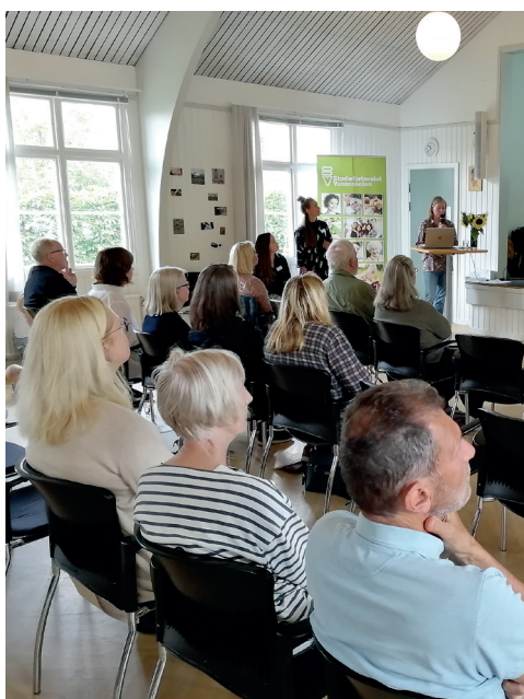
Publiken fick möjlighet att ställa frågor om projektet.