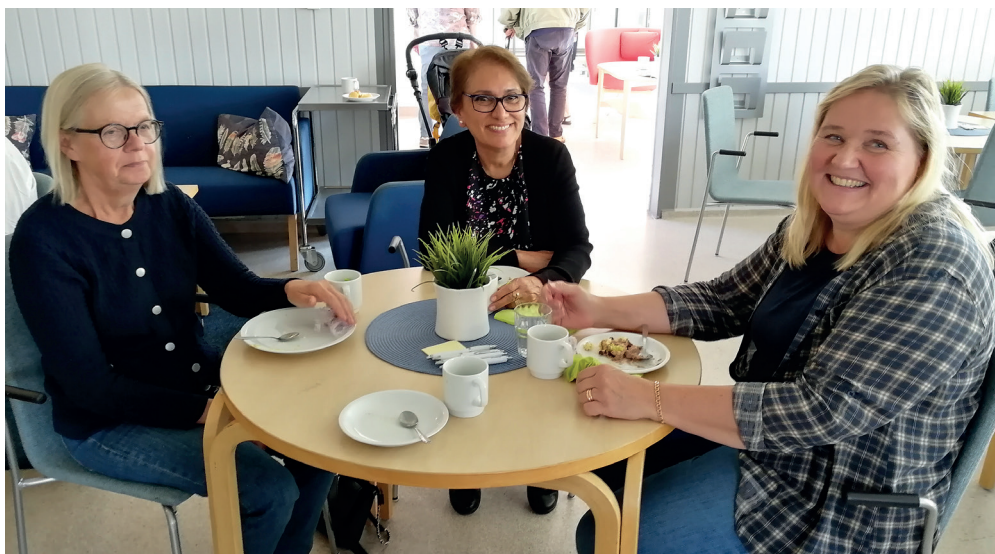
Cirkelledare och anhöriga diskuterade vid fiket.