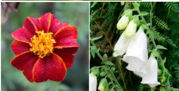
Linnés sammets- blomster Digitalis