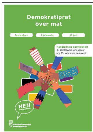
Demokratiprat över mat Handledning