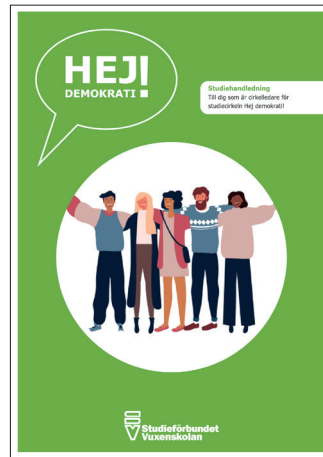
Hej demokrati! Studiehandledning