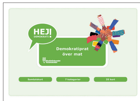
Demokratiprat över mat Samtalskort