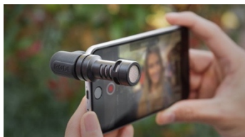
Røde VideoMicro – passar mindre kameror och mobiltelefoner typ iPhone och Android (ca 500 kr)