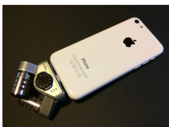
Zoom iQ6 - passar iPhone, iPad och iPad Touch (ca 1000 kr)