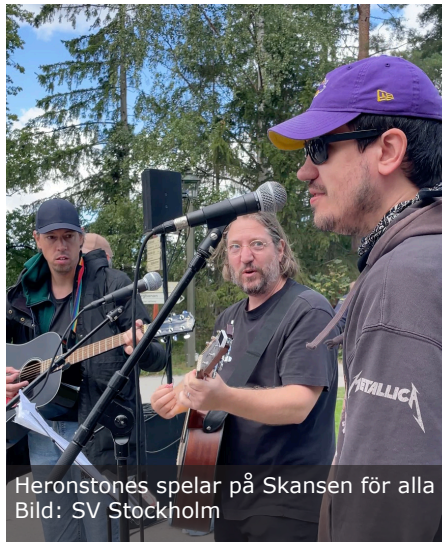
Heronstones spelar på Skansen för alla